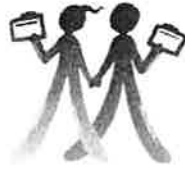
協会シンボルマーク