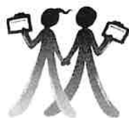
協会シンボルマーク